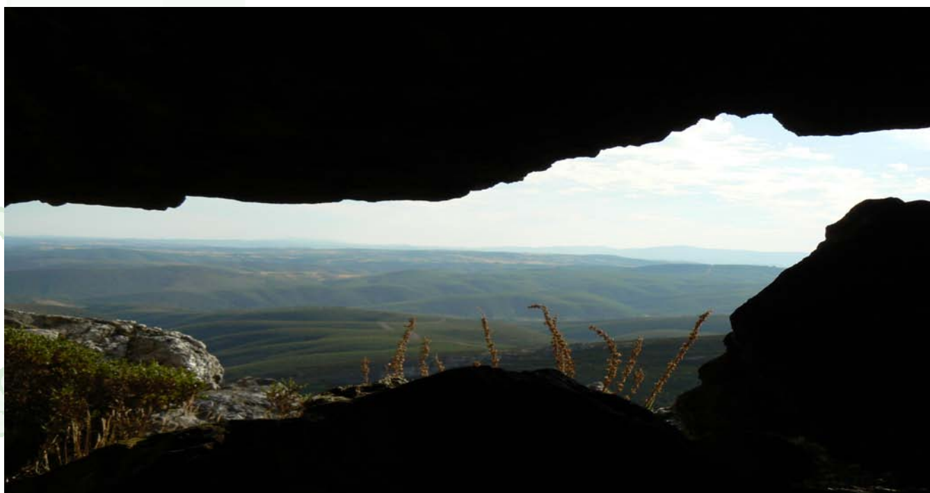
Aliste desde El Portillón