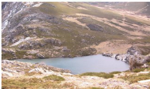
Lagoa da Serpe

Como en toda tradición oral, existen diferentes versiones aunque el argumento principal es siempre el mismo. Se trata de una temática abundante en la literatura popular de las provincias de León y Zamora: encantamientos, hadas, doncellas y seres mágicos siempre situados en lagunas, fuentes, castros y peñas en ambientes brumosos, mágicos y misteriosos... de “ mouros ” como dirían en Sanabria.