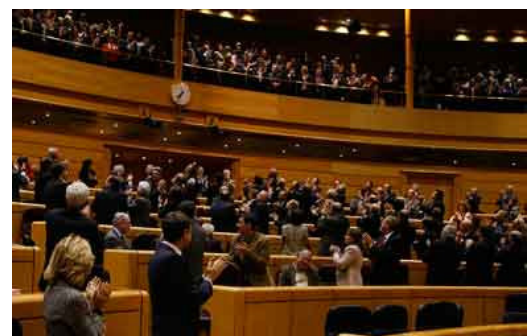
Aprobación en el senado

Nuestra asociación considera que se trata de un avance muy importante en la conservación y dignificación del patrimonio lingüístico de la provincia y en el reconocimiento de los derechos de los hablantes de leonés y gallego de Castilla y León.